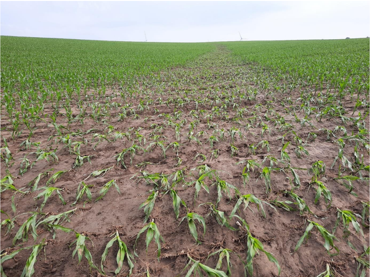
Erosionsbahn mit Erosionsrinnen