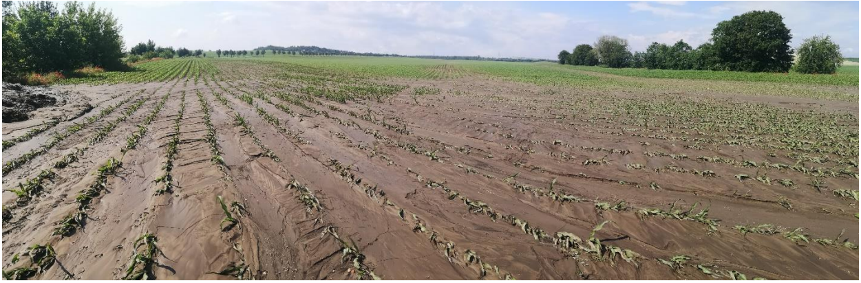
Schäden durch Erosion auf dem Feld selbst (onsite-Schäden)